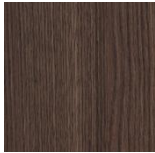
BROWN OAK 1836